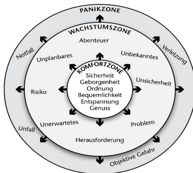
Abb.1: Lernzonenmodell (vgl. Michl 2015:40 (in Anlehnung an Luckner & Nadler 1997))

Das Lernzonenmodell oder auch das Komfortzonenmodell ist ein Kreismodell mit drei Ebenen. Das Zentrum ist die Komfortzone, die zweite Ebene besteht aus der Wachstumszone und die dritte Ebene aus der Panikzone. Ziel der Erlebnispädagogik ist, durch herausfordernde Situationen die Teilnehmer in die Wachstumszone zu führen. Die Wachstumszone ist je nach Zielgruppe (Kinder, Jugendliche, Erwachsene) neu zu bewerten. Die Besonderheit ist, dass sich das Komfortzonenmodell von Teilnehmer zu Teilnehmer verändert.