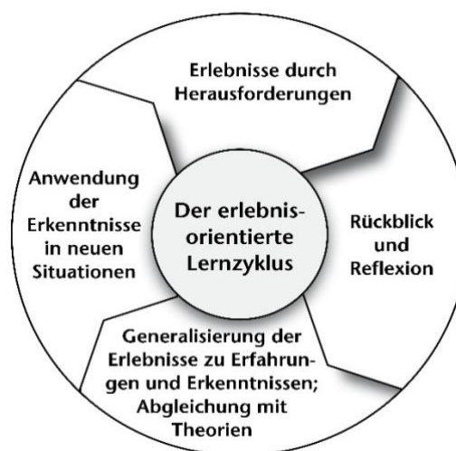
Abb. 2: Experiential Learning Cycle (in Anlehnung an Michl 2015:43, nach Kolb 1984)

Die vier Schritte zeigen, dass der Erfolg am Ende einer erlebnispädagogischen Aktion die Übertragung des Gelernten in den eigenen Alltag ist. Das Besondere an diesem Zyklus ist, dass er von jedem Schritt aus gestartet werden kann. So ist es auch von Teilnehmer zu Teilnehmer unterschiedlich, wie bei einer Kooperationsübung oder Problemaufgabe begonnen wird.